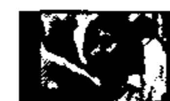
Afriani Tidak Boleh...