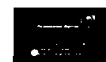
Afriani Akan Dijerat