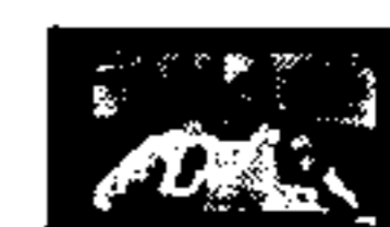
Afriani Dikenal Dekat