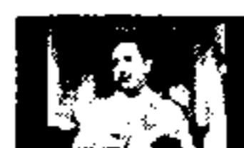
Mobil Diduga Dipacu