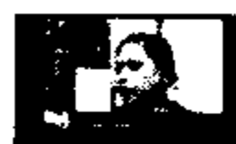
Diru Menant Kelahiran