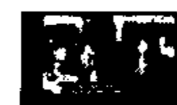
Warga Ngungsi karena